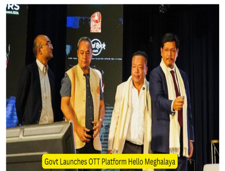
Govt Launches OTT Platform Hello Meghalaya