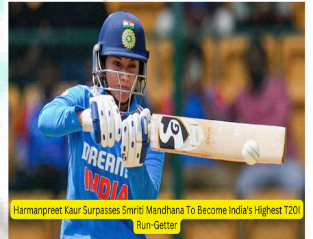
Harmanpreet Kaur Surpasses Smriti Mandhana To Become India's Highest T20 Run-Getter

(A) हरमनप्रीत कौर अब स्मृति मंधाना को भारत की और से हिटकर महिला टी-20 इंटरनेशनल क्रिकेट में सबसे ज्यादा रन बनाने वाली खिलाड़ी बन गई है। यह उपलब्धि दांबुला में भारत के खिलाफ महिला एशिया कप टी-20 मैच के दौरान हासिल की गई। फ्राईथ ने टॉस जीतकर पहले गेंदबाजी का फैसला किया, स्मृति मंधाना 13 रन बनाकर आउट हो गई।